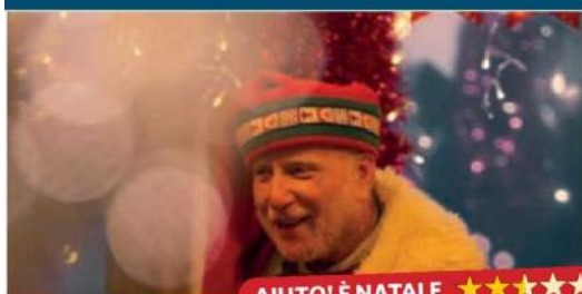
AIUTO! È NATALE ★★★★★