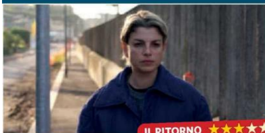
IL RITORNO ★★★★★