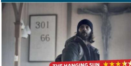
THE HANGING SUN ★★★★★