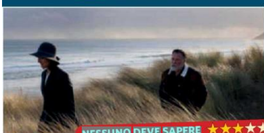
NESSUNO DEVE SAPERE ★★★★★