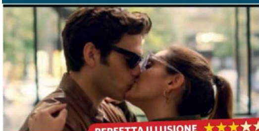
PERFETTA ILLUSIONE ★★★★★