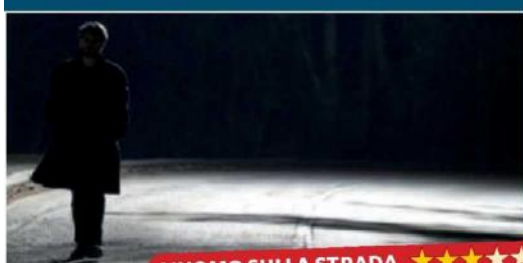
L'UOMO SULLA STRADA ★★★★★